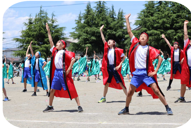
〈6年生：開明ソーラン「魂を込めて」〉

今年度は「低学年・高学年に分かれての運動会」という形で行いました。学年の種目は2つですが、それぞれの学年で『運動会を通してつける力』を明確にし、児童と共に創り上げることを大事に取り組んできました。運動会当日は、それぞれが運動を楽しみ、そして自信を持って競技に臨む姿がありました。保護者の皆様の温かい見守りや声援が力になったことと思います。練習の間も、様々な面で支えていただきありがとうございました。