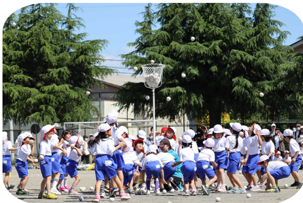
〈1年生：玉入れ「うまく入るかな」〉