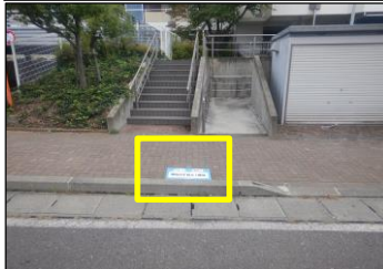
寿台-5 寿台3丁目A1棟北:路面貼付型 建物北側の道路、ゴミステーション前の歩道