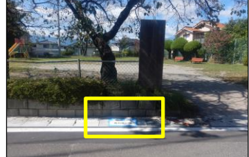
寿台-3 寿台南公園:路面貼付型 公園東側