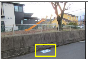
寿台-15 寿台9丁目キリン遊園地:路面貼付型 公園北側