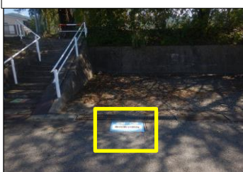
寿台-13 寿台東公園西:路面貼付型 公園西側