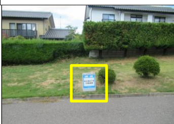
寿台-10 寿台東6丁目10組遊園:縦看板型 公園南側