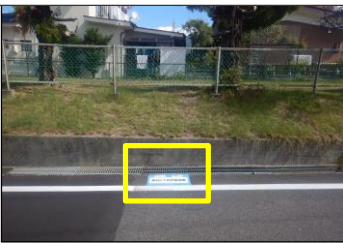
寿台-4 寿台2丁目児童遊園:路面貼付型 公園西側