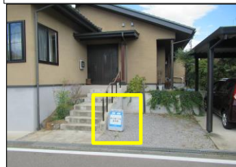
寿台-11 寿台東7丁目通学路:縦看板型 道路東側の住宅前