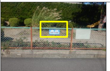
寿台-9 寿台東6丁目2組遊園:フェンスに表示 公園東側