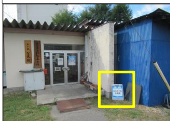
寿台-7 寿台5丁目公民館:縦看板型