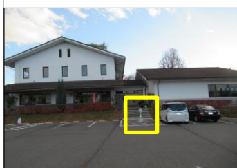
公共-2 寿台公民館・寿台図書館:サイントワー型 敷地内での乗降、建物入口正面