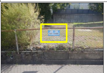
寿台-12 寿台東7丁目児童遊園:フェンスに表示 公園西側