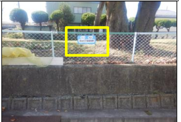
寿台-6 寿台4丁目緑地帯:フェンスに表示 公園北側、ゴミステーションの右側