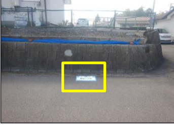
寿台-1 寿台1丁目:路面貼付型