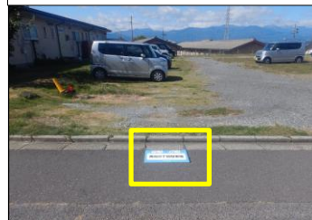
寿台-14 寿台8丁目駐車場:路面貼付型 駐車場東側