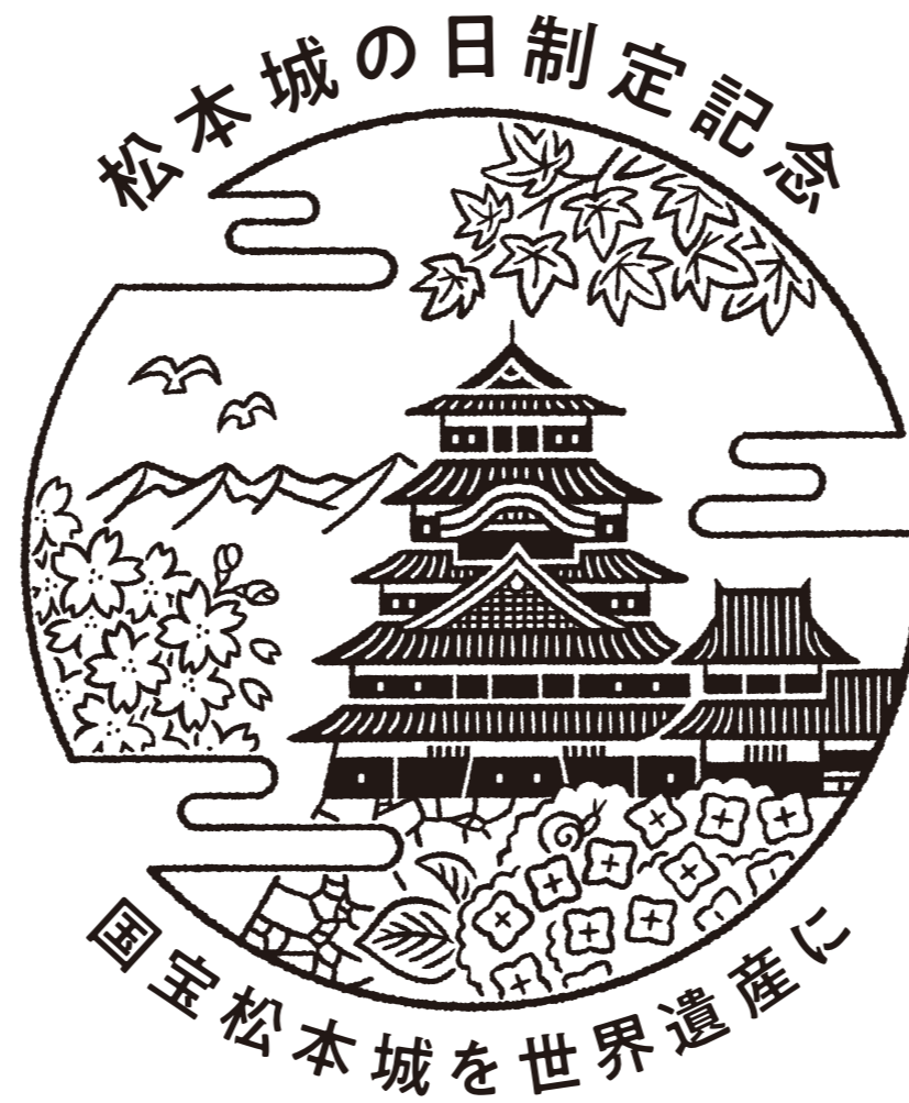
『松本城の日制定記念』ロゴ運用マニュアル