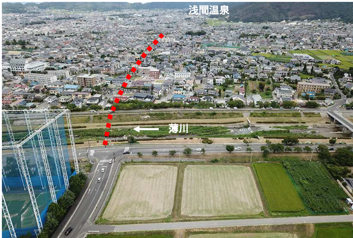
(里山辺南小松から浅間温泉方面を望む)