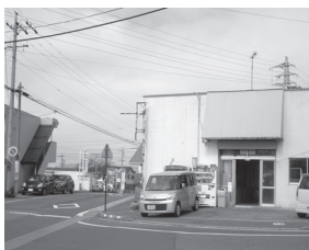
「集い場ふらっと」は、並柳商店街の一角にあります。

住民同士の交流や外出のきっかけ作りとして、フリースペースや絵画教室、麻雀や将棋などを楽しむ会(脳トレ)、介護の悩みなどを話す茶話会(いきぬきカフェ)、大切な人を亡くした人達が抱えている様々な思いを語り合う場グリーンカフェ(涙カフェ)などを定期的に開催しています。また子ども食堂(なみカフェ)も昨年の4月からふらっとカフェ