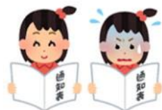
つうちょう 通知表もらって見たら……