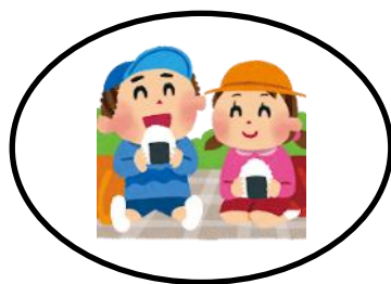
えんぞくたの 遠足楽しかった!