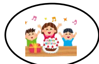
たんじょうび 誕生日だよ