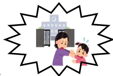
がっこうい 学校行きたくない