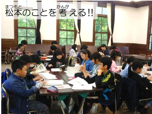
まつもと 松本のことを考える！！