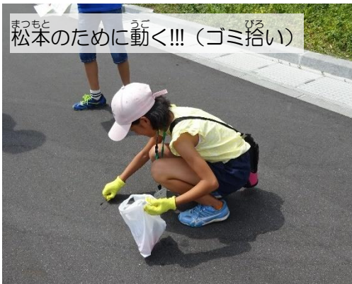
まつもと 松本のために動く!!! (ゴミ拾い)