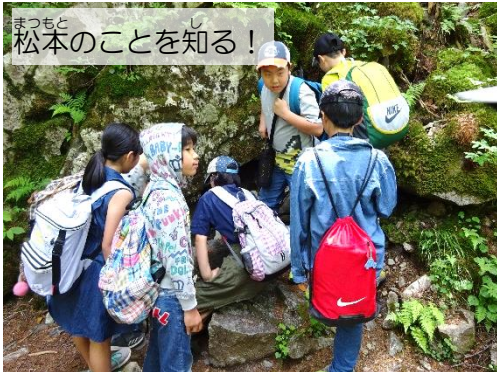
まつもと 松本のことを知る！

「社会に参加する権利」を大切にするため、「まつもと子ども未来委員会」が活動しています！！