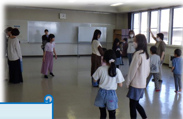
こどもたちが 楽しく遊べる場所