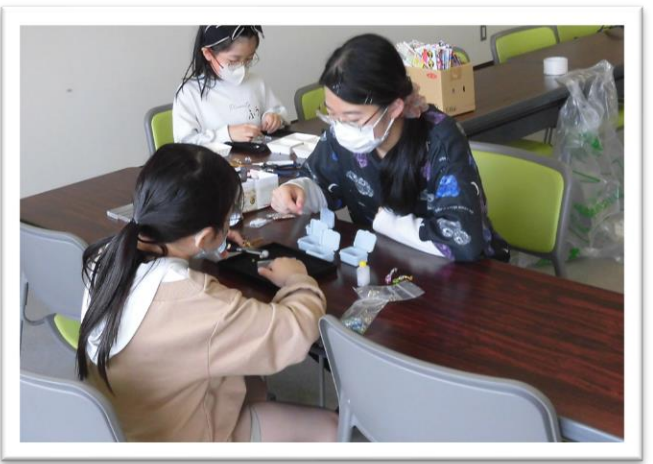
【お姉さんに教わりながらアクセサリー作り】