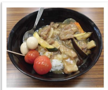
【毎回みんなで晩御飯を美味しくいただきました】