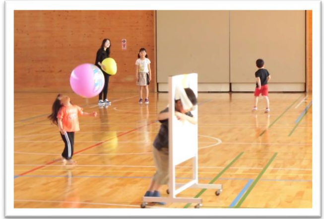
【体育館を開放してみんなで運動】