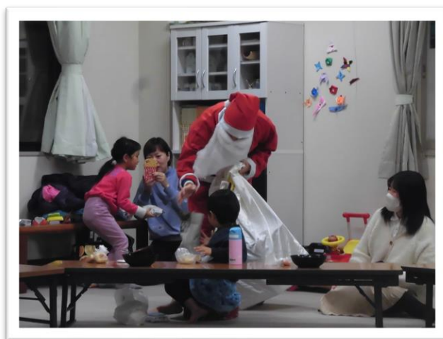
【クリスマス サンタさんからプレゼント】