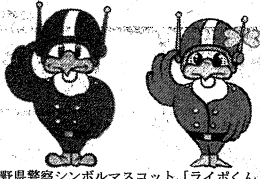
長野県警察シンボルマスコット「ライボくん ライビちゃん」