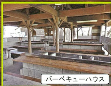
バーベキューハウス

セットメニューには食材・タレ・備品「炭・網・取り皿・割り箸・コップ・焼きそば用プレート」施設使用料が含まれます。(備品・タレ等の追加は別途料金が発生致します)