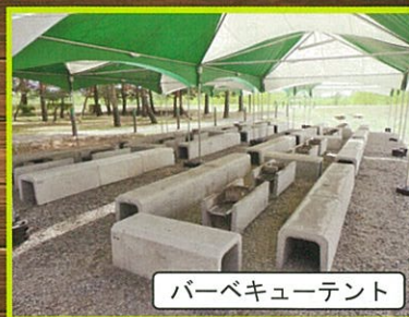
バーベキューテント