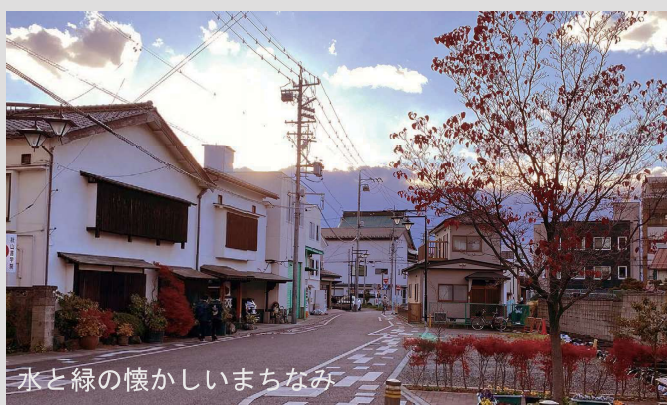
水と緑の懐かしいまちなみ