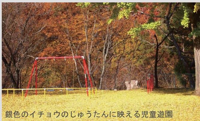
銀色のイチョウのじゅうたんに映える児童遊園