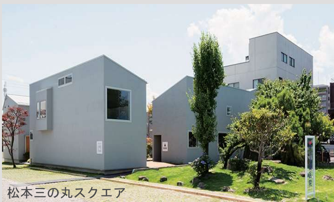
松本三の丸スクエア