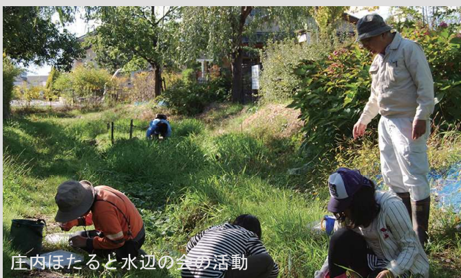
庄内ほたると水辺の会の活動