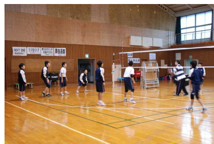
〈ボールをよく見ていこう〉