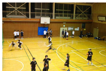
〈ゴールに向けて粘り強く！〉