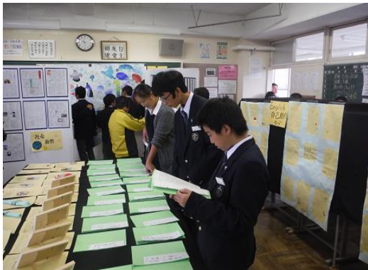
↑〈美術部作製のステージバック〉

中学校初めての文化祭。クラス展示は、頑張って作ったマルチラックや皆との思い出もつまった「さるぼぼ」、短歌や意見文をきれいに飾ることができてよかったです。(1年生)