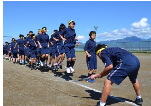
〈若鷹杯・大縄跳び〉