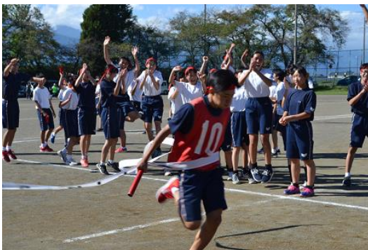
〈若鷹杯・全員リレー〉