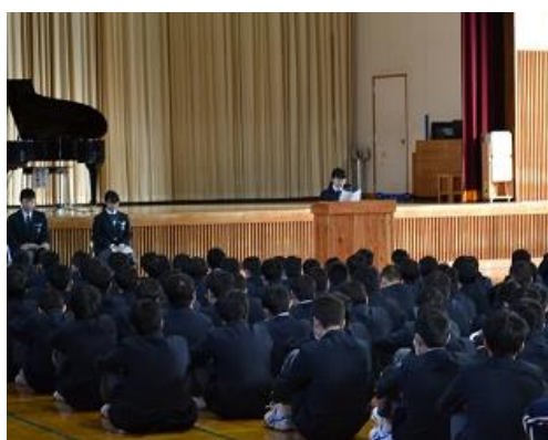
〈姫路交流キャンプ報告・ 3 学期の意気込み(3 年生)〉