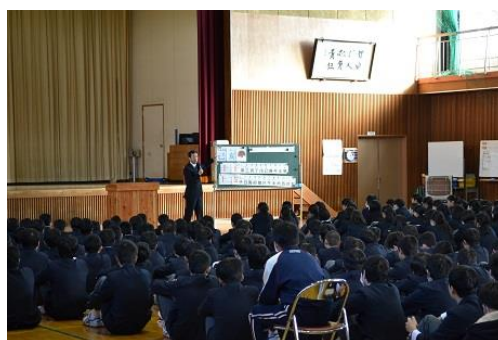
〈始業式での校長の話〉

冬休み中の課題であった、書き初めの展示をしました。1 年生は「不言実行」2 年生は「調和」3 年生は「大志を抱く」という課題でした。中学生らしい、伸び伸びとして力強い書がたくさんあります。特に、1 年生は 1 2 月の国語の授業中に、地域の方より書写のご指導をしていただきました。その成果が現れている書になったのでしょうか。