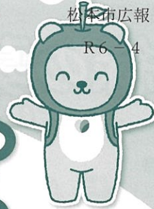
長野県PRキャラクター 「アルクマ」 ©長野県アルクマ