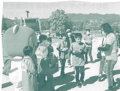
スポーツイベント会場での募金活動