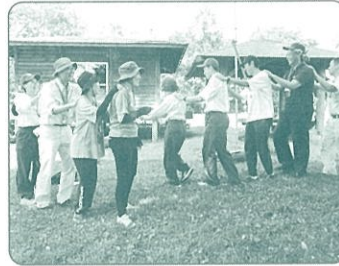
指導者スキルアップ研修会

各地区での身近な緑化活動や、 森林ボランティア団体等を対象とする公募事業、 みどりの少年団の育成などに活用しています。