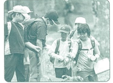
みどりの少年団交流集会