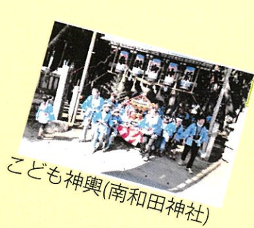
こども神輿(南和田神社)