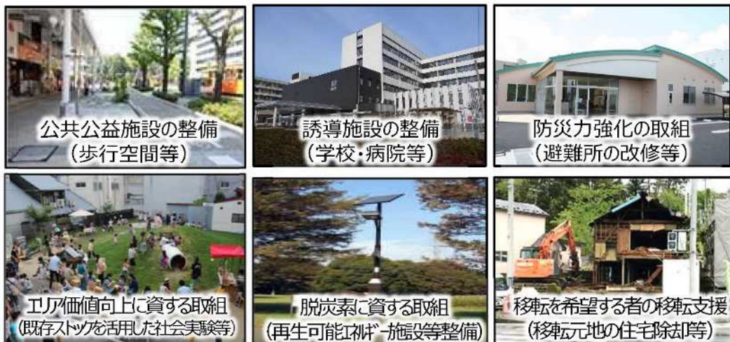
図 都市構造再編集中支援事業の位置づけ