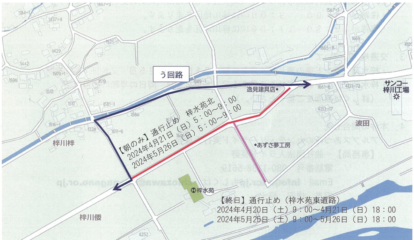
▲交通規制図 — 通行止め区間 大会早朝 — う回路 — 通行止め区間 大会期間中