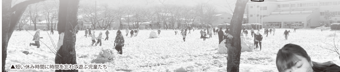
▲短い休み時間に時間を忘れて遊ぶ児童たち

1月25日、餅つき大会が開催されました。コロナ明け、4年振りの開催とあって、親子16組30人が参加しました。餅つきを間近で見るのは初めてとあって興味深々。子ども用の杵を持つてのチャレンジに大きな歓声があがります。 つき上がったお餅は、農村女性委員会のみなさんが、きなこ、ゴマ、大根おろし餅に、「お餅っ