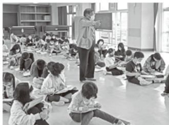
▲芳川小にて「四ヶ塚」についての特別授業を