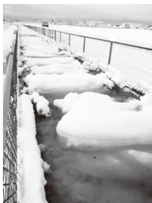
▲2024.2.5の積雪量は27cmだったが、数年ぶりのまと った雪で、河川や堰に雪が投げ込まれ、各地で水路があふれた。 雪かきの雪は水路や道路に投げないようにして下さい。