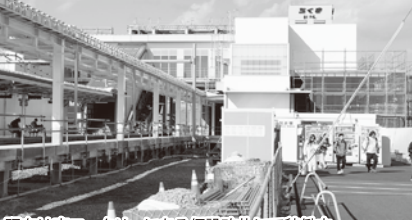
現在は南ロータリーにある仮設改札にて稼働中