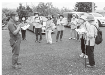
▲ふれあいウォーク「紫陽花寺」にて