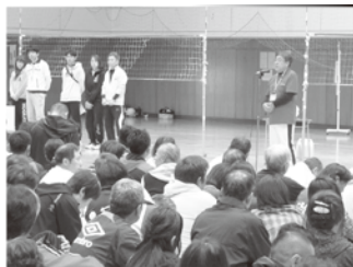
▲芳川公民館長杯ソフトバレーボール大会にて