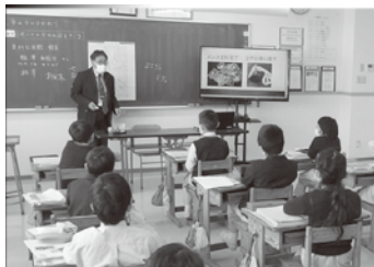
△村井町について才教学園で特別授業を