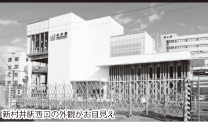
新村井駅西口の外観がお目見え