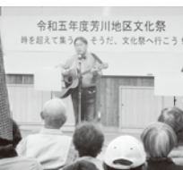
令和五年度芳川地区文化祭 時を超えて集う。そうだ、文化館へ行こう！