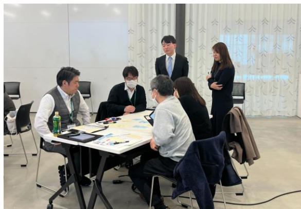
具体的ユースケースのアイデアを企画・発表