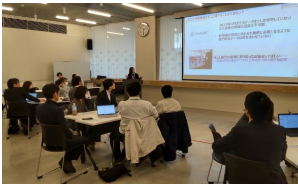
生成 AI の基本理解