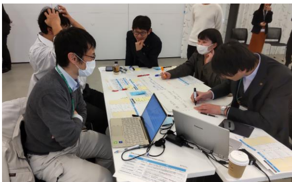
業務における生成 AI 活用を検討