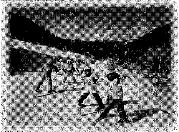
天候にも恵まれ、みんな夢中になってスキーにチャレンジしました。