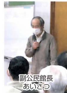
副公民館長 あいさつ