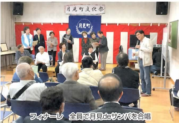
ファイナル 全員で月見deサンバを合唱