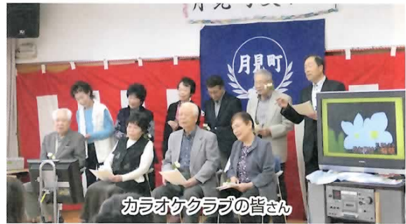
カラオケクラブの皆さん