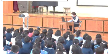
低学年性の多様性講座

から、動物の世界では同性カップルがたくさん存在し、好きになる性は異性とは限らず、多様であることを知りました。