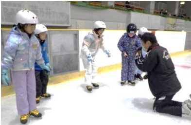
体のバランスをとりながら

11月、低学年のスケート教室がありました。最初は慣れない氷とスケート靴に緊張していましたが、インストラクターの話聞きながら、次第に体をすくっと立たせ、滑ることができるようになっていきました。学校ではできない、冬のスポーツを楽しみました。例年のことですが、各学年の保護者の皆様には、ボランティアへの応募と靴ひも縛りへのご参加、ありがとうございました。