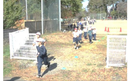
150周年記念事業で広がっていただいたフェンスを抜けて

さて、冬の取り組みと云えば、マラソン記録会。児童会の呼びかけにより、登校してくると元気に校庭を走り、教室に戻るとうれしそうにカードに走った周回数を記入する姿が見られます。今年から、校庭と校舎周りのコースに変わりました。マラソン記録会の目当ては一人一人違いました。着順を目標にする子もいれば、完走を目標にする子もいます。高学年では走る道のりも選択します。自分の決めた目当てに向かって取り組む姿を認めていきます。