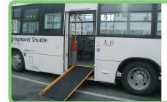
車イス用スロープ付ワンステップバス

お年寄りや体の弱い方にも乗りやすいノンステップバス・ワンステップバス(車イス用スロープ付)を松本市内路線バスや「タウンズニーカー」などに使用しています。