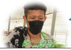
とれたてのものを あずさがわ とど 梓川からお届けします

たね しゅうかく やく にち みず た 種をまいてから収穫まで約30日！水が足りなくなるとかれてしまうの で、まいにちてんけん か にち やす せ わ で、毎日点検が欠かせません。1日も休まず、お世話をしています。