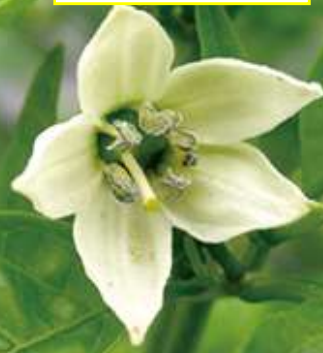
び い ま ん はな ピーマンの花

び い ま ん たて き にが かん ピーマンを縦に切ると、苦みを感じにくいよ！