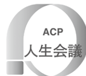
「人生会議のロゴマーク」