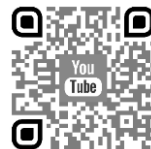
[インターバル速歩とは?]

近年の研究で、通常のウォーキングだけでは筋力・体力の向上、健康改善はあまり見込めないことがわかってきました。そこで開発されたのが「 インターバル速歩 」です。 個人の体力に応じた強度 でゆっくり歩きと速歩を繰り返す運動方法で、5ヶ月間で体力10%UP、生活習慣病が20%改善します。NPO法人熟年体育大学リサーチセンターではこの科学的根拠に基づいたインターバル速歩を指導しています。最近、NHK「あさイチ」、「あしたが変わるトリセツショー」でも取り上げられました。