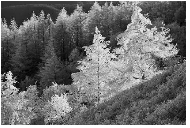
鉢伏山の霧氷 (撮影：2019.11.29 鉢伏山)