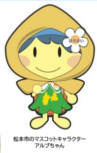
松本市のマスコットキャラクター アルプちゃん

※令和6年2月18日までに松本安心ネットへ登録済みの方は、再登録のお手続きは不要です。(登録情報は自動で引き継がれます。)