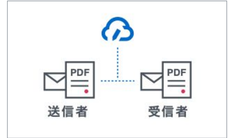
締結後書類を印刷・PDFで保管