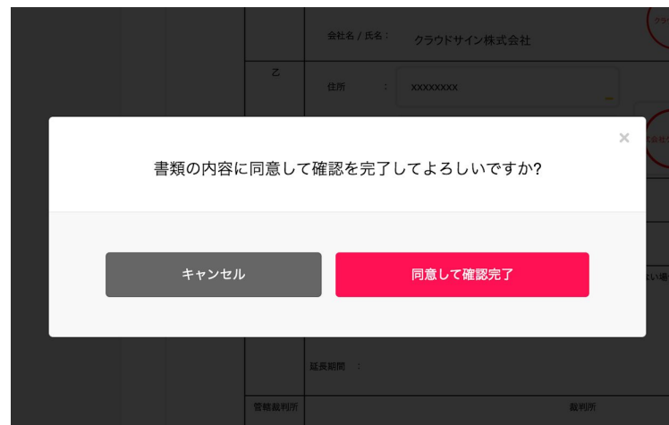
契約書確認・合意