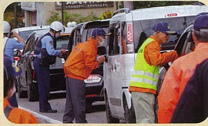
管内の主要交差点において交通事故防止啓発活動を実施した。