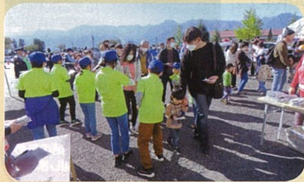
警察署主催のふれあいコンサート会場において少年部員による啓発活動を実施した。