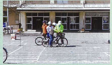
市内の小学校の交通安全教室において、児童に自転車の正しい乗り方について指導した。