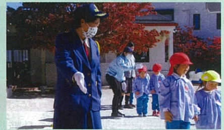
市内の幼稚園において女性部と市の交通安全教育担当で交通安全教室を実施した。