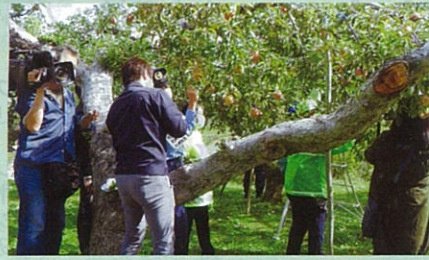
交通安全活動の一環として関係機関に配布する「交通安全リンゴ」のシール貼りを行った。