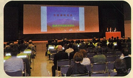
「交通安全協会長野県大会」において活動事例を発表した。