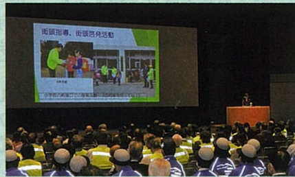
「交通安全協会長野県大会」において活動事例を発表した。