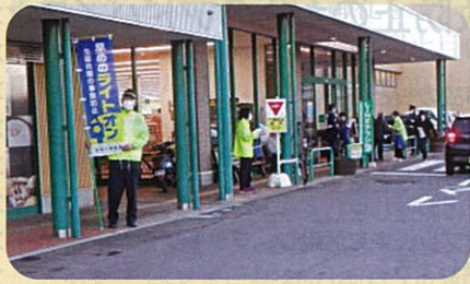
管内の商業店舗前で交通事故防止を目的とした啓発活動(サンセット作戦)を実施した。