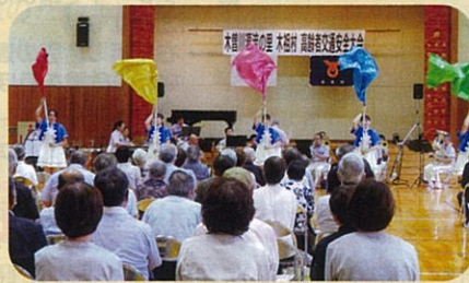
管内の小学校体育館において「高齢者交通安全大会」を開催した。