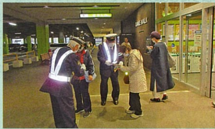
夜間における交通事故防止啓発活動として、管内の大型商業施設においてサンセット作戦を実施した。