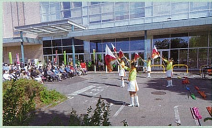
管内の商業店舗で県警音楽隊の演奏等を含めた交通安全イベントを実施した。

交通安全協会は、交通事故をなくすため、様々な活動を行っています。活動の一例を紹介します。