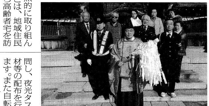
岡の宮社新年交通祈願祭 東町支部：昭和37年から毎年1月3日会員と役員が交通安全を願って行っています。

支部の活動は、各町会役員と情報交換し危険箇所を把握してハザードマップを作成し交通安全教室等に活用して、交通事故防止に役立てております。