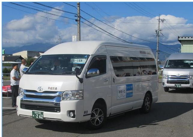
2 台の車両が寿エリアを運行しています。