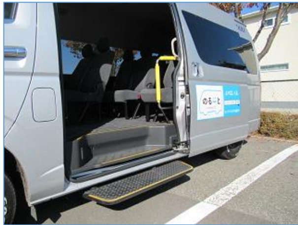
乗降車時には自動でローステップと手すりが出ます。