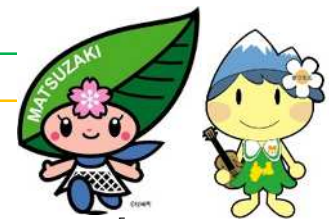
松崎町マスコットキャラクター「まっちゃん」

平成17年の松本市との合併後は、地域間交流として、安曇地区町会連合会が主体となり交流を続けています。