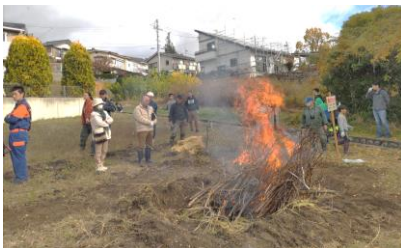
勢いよく炭火づくり

焚火での焼いも大会で320名の参加がありました。日頃、体験できない焚火で炭を起こし、サツマイモをその中に放り込んで焼きあがるのを待ちました。その間には、スポーツ協会が実施した「〇×クイズ」で盛り上がっていました。