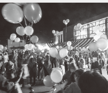
夢を乗せて天までとどけ

食事エリア・ゲーム・演舞・福引・子どもひろばなど、多彩な内容です。特に、おぼけ屋敷は中学生が主体