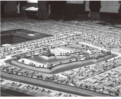
現在の街並みと重ねた地図も置いてあります

3階常設展示室には、江戸時代後期の城下町を再現した全国最大級の「松本城下町ジオラマ」が展示されています。