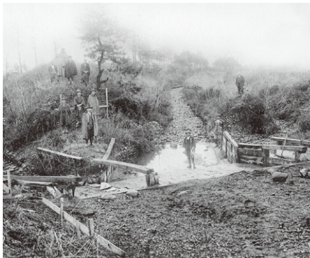
(撮影：昭和8 (1933) 年秋)