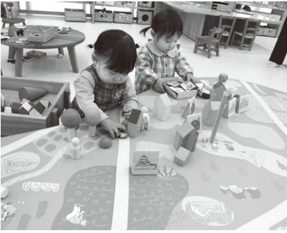
いっしょに「まちをつくろう」

子どもを対象とした「こども体験ひろばアソビバー」では、自由に遊びながら松本のことを知ることができま