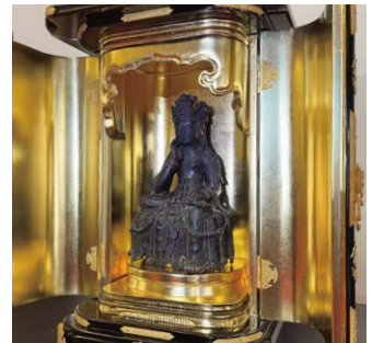
県宝銅造半跏像（奈良時代）若澤寺ゆかりの弥勒菩薩像です

今の波田地区になったのは明治7（1874）年、上波多村・下波多村・三溝村が合併し、波多村ができたことによります。