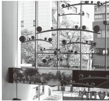
手まりモビールと映像

地図に建物などのアイテムを並べる「まちをつくろう」、動物と背比べをする「まつもとのもり」、木の玉や手まりを触って転がす「てまりおんせん」。子どもの興味を育てるだけでなく、大人も一緒に遊んでください。会話の中から新しい発見があるかもしれません。