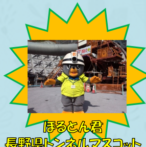
ほるとん君 長野県トンネルマスコット