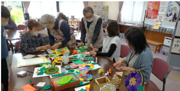
▲福祉ひろばの様子(クラフトバントで製作)

公民館では、活動サークルのステージ発表や作品展示のほか、田川小学校金管バンドの演奏、松本蟻ヶ崎高等学校書道部による書道パフォーマンスなどが披露されました。