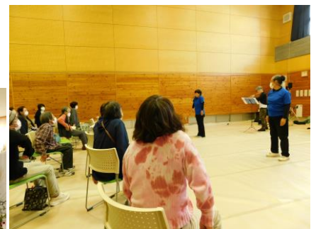
▲音楽にあわせて、皆で体操(健康体操スマイル)