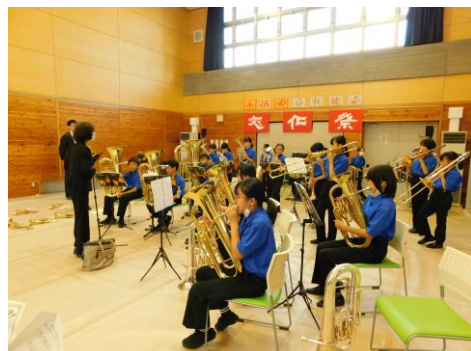
▲田川小学校金管バンドの演奏