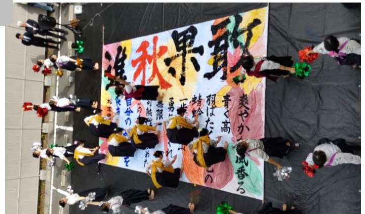
▲松本蟻ヶ崎高等学校書道部による書道パフォーマンス

公民館やひろばから離れた地区にお住まいの方にも気軽に来ていただけるように、送迎タクシーを運行しました。お年寄りや小さな子供連れなど、延べ32人の利用がありました。