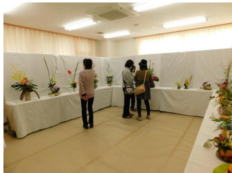
▲公民館での「暮らしの花」、「れんげつつじ」作品展