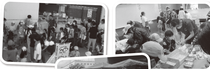
約600人が 参加しました!