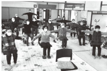
筑摩にお住まいなら誰でも 毎週月10時～11時30分 場所は、筑摩公民館