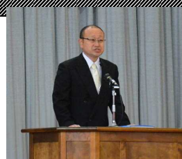
着任式で挨拶する津野校長先生