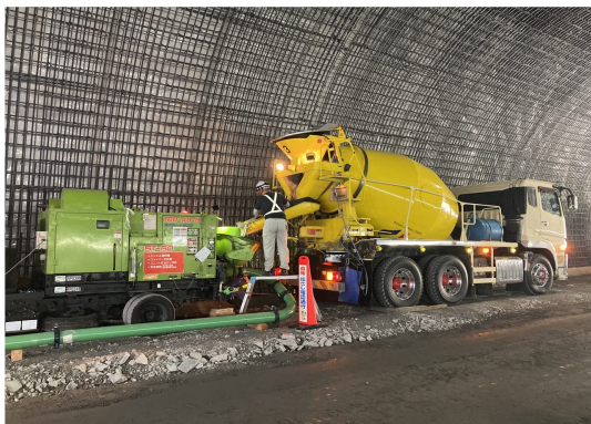
覆工コンクリート打設

今後も引き続き、安全に留意しながら工事をすすめて参りますので、何卒ご協力をよろしくお願ひ申し上げます。