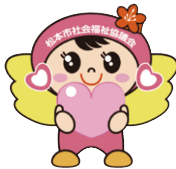
松本市社会福祉協議会 マスコットキャラクター つむぎちゃん