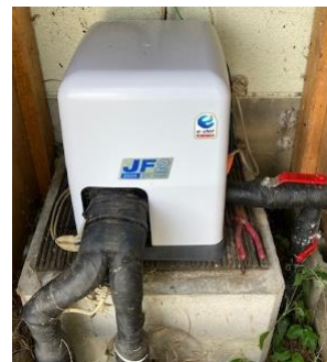
今回、ご支援をいただいた 深井戸水くみ上げポンプ