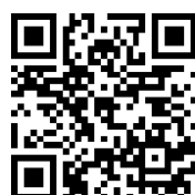
上高地自然観察会 申込み