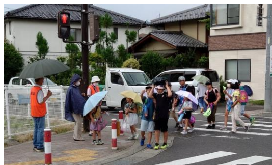
住み協のつながり隊に参加し下校見守りを開始

「身近な相談相手」の民生委員、児童委員にお気軽にご相談ください。今月より民児協の活動を順次お伝えしていきますのでよろしくお願い致します。