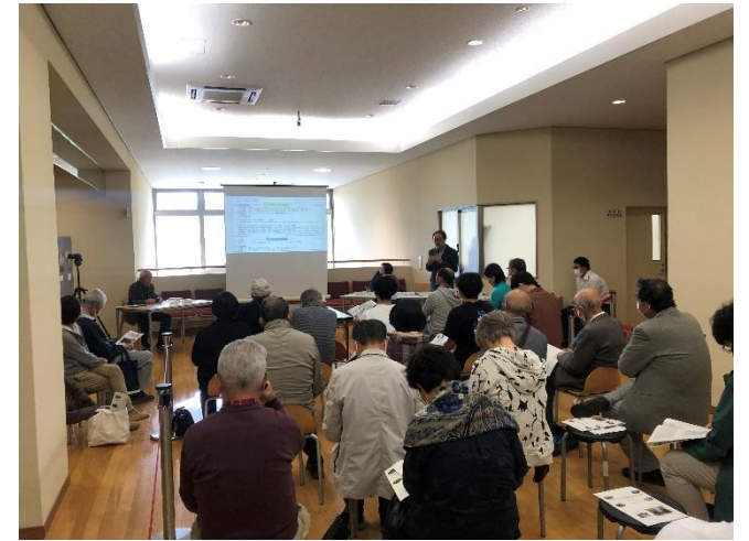
アルプス公園の未来を語ろう会 (R5.4.29)