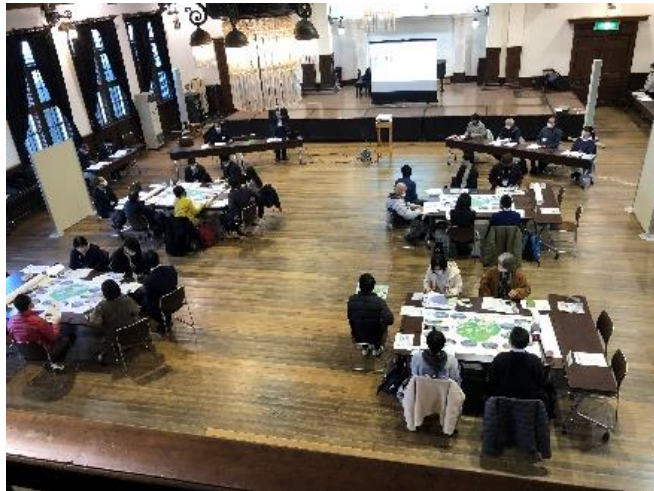
アルプス公園魅力向上ワークショップ (R5.1.22)