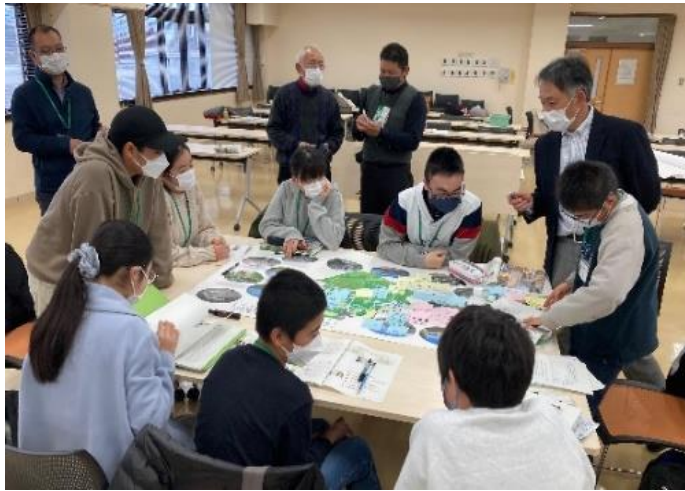
まつもと子ども未来委員会 (R5.1.15)