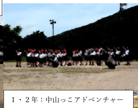
1・2年：中山っこアドベンチャー