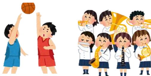
部活動もいろいろあって (´;ω;`)ウツ…