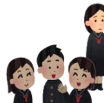
人間関係って難しい