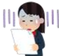
ガーン 点数が下がった