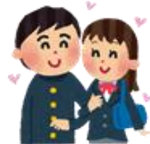
新しい友達できたよ♪