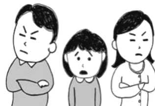
ケンカしちゃった。悲しいなあ～