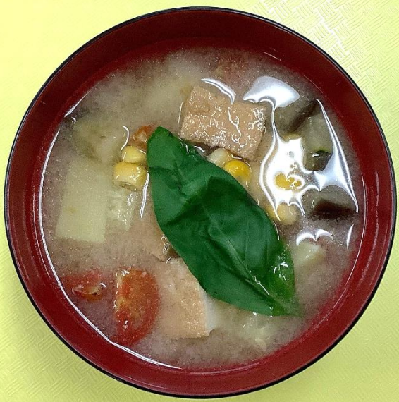
第3回具たくさんみそ汁コンテスト 松本を味わおう部門