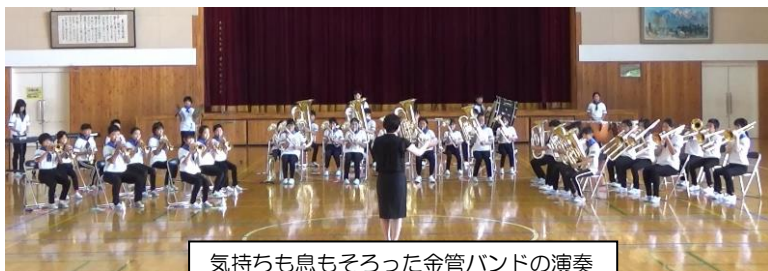
気持ちも息もそろった金管バンドの演奏

夏休み中に開催されるバンドフェスティバルに向けて、1学期から土曜日や放課後、夏休みにも練習を重ねてきた金管バンド。ステージでの演奏を楽しみにしていましたが、新型コロナウイルス感染症の感染拡大により、今年度もビデオによる審査となりました。