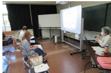
口は健康の入り口。仕上げ磨きも大切

この他、夏休み中、職員は、ICT機器利用に係わる情報モラル等の研修や非違行為防止研修を実施いたしました。