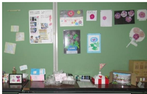
1年生の教室前に並ぶ作品の数々

2学期は、各学年の旅行行事や音楽学習発表会等、様々な行事が予定されていますが、新型コロナウイルスの感染拡大も心配です。そのひとつひとつについて対策をしながら、充実させていきたいと考えていますので、よろしくお願ひします。